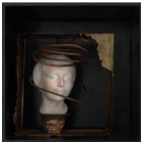
L'inconnue de la Seine.

Over l'inconnue de la Seine zijn op het internet vele verhalen te vinden. Wie meer over de tentoonstelling wil weten, zie op internet Kunstencentrum K38 en vervolgens de video Assemblage.