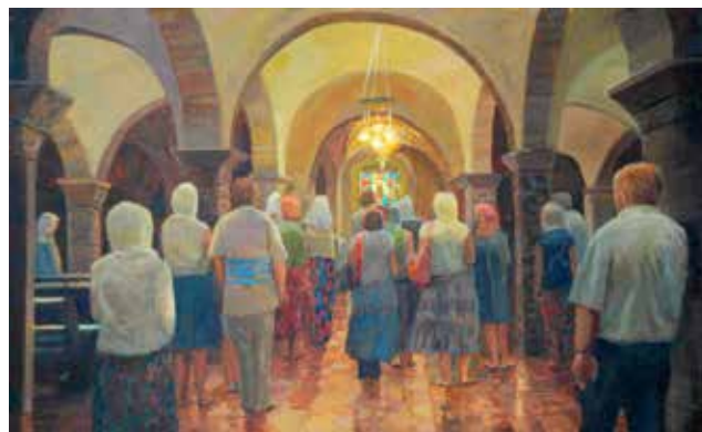
Mark Lisser, Bij het graf van Sint Nicolaas, acryl op board, 40 x 60 cm.

In dat opzicht zijn de QuasiRealisten schatplichtig aan stromingen als Symbolisme, Surrealisme en Magisch Realisme. De QuasiRealisten staan open voor alle disciplines zoals beeldhouwkunst, fotografie, film, dichtkunst en conceptuele kunst. Het idee tot groepsvorming is ontstaan door het gezamenlijk exposeren van de oprichters op een tentoonstelling van vervreemdende kunst van professionele kunstenaars uit het Noorden in Museum Stad Appingedam. Die tentoonstelling had plaats in het kader van de manifestatie 'Renaissance in het Noorden' in het voorjaar van 2012 in de drie noordelijke provincies.