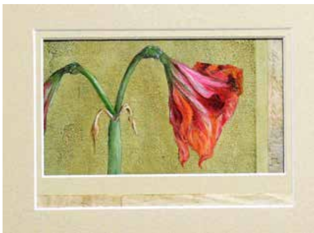
Jowan Remmig, Dode amaryllis, olieverf en collage, 42 x 36 cm.

Ook Jowan Remmig is een veelzijdig kunstenaar, die zich niet laat begrenzen door één bepaalde discipline. Hij verzamelt de meest uiteenlopende voorwerpen, variërend van vogelbotjes tot oude teksten, die hem inspireren tot het creëren van een kunstwerk. Hij maakt collages, etsen, steendrukken en combineert daarbij allerlei technieken.