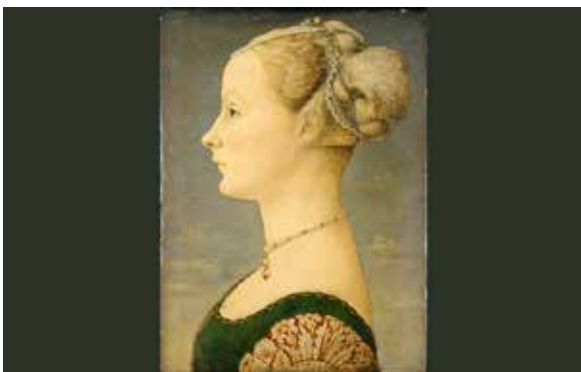
Antonio da Pollaiuolo (1433-1498), Portret van een jonge vrouw: een van de hoogtepunten uit het Museo Poldo Pezzoli in Milaan