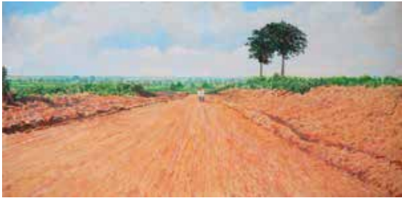
Mark Lisser, Ivoorkust , acryl op paneel, 22 x 44 cm.

In het vorig nummer heb ik verteld over mijn nieuwe serie 'Het Geografisch Middelpunt'. Van elk land op aarde schilder ik het landschap rond het geografisch middelpunt. De helft is ongeveer klaar. Deze helft is komende zomer te zien in De Open Stal in Oldeberkoop in Friesland. Sinds 1971 stellen particulieren daar een ruimte bij hun huis of bedrijf beschikbaar om kunst van professionele kunstenaars te tonen. Het is een van de eerste kunstroutes in Nederland. Dit jaar wordt de Open Stal gehouden van zaterdag 29 juli tot en 27 augustus. Ik toon mijn serie in de Multifunctionele Accommodatie (MFA) van Olderbekoop. [afb]