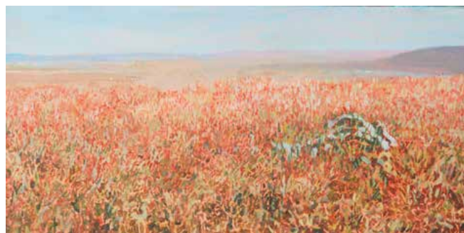
Het geografisch middelpunt van Mongolië, acryl op paneel

Sinds september 2015 ben ik bezig met mijn grootste serie. Ik schilder van elk land op aarde het geografisch middelpunt. Google Earth zoekt voor mij het geografisch middelpunt van een land. Ik zoom op die plek in en verzamel dan fotomateriaal over die plek. Dat kan via Google Streetview, of ik open op die plek een link naar fotomateriaal, of ik typ een plaatsnaam in, die ik daar vind, en zoek op Google afbeeldingen naar beelden. Ik laat mij door het beeldmateriaal inspireren. Ik maak dan een schilderij in de sfeer, zoals ik het mij voorstel, dat die plek heeft. Ik kies voor een bepaalde kleur als ondergrond om de sfeer van het land te treffen. Elk schilderij is een kleurexperiment. Ik heb nu meer dan 90 landen geschilderd en het wordt steeds leuker en spannender om te doen. Donkere oerwouden, grijze steden en woestijnlandschappen wisselen