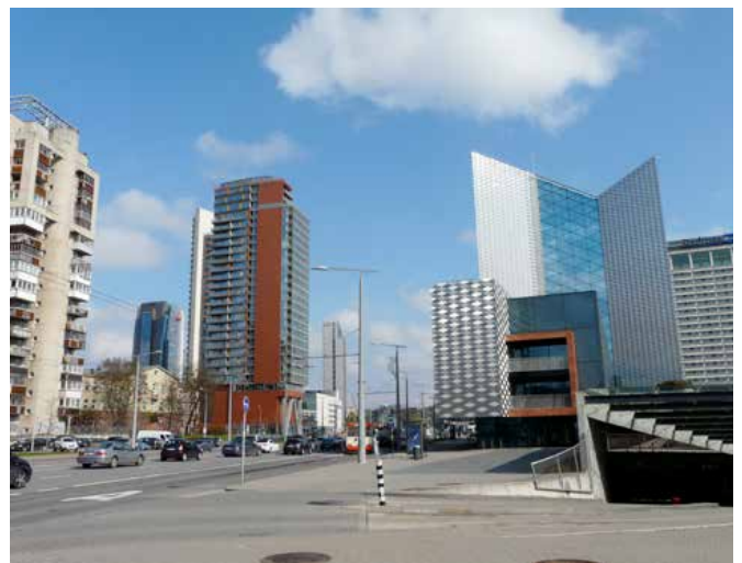
Moderne architectuur in Vilnius

De Pools- Litouwse vorsten waren zeer tolerant voor Joden, zodat er een zeer bloeiende Joodse gemeenschap ontstond, die helaas helemaal verdwenen is door de bezetting van Nazi-Duitsland. De sporen van deze cultuur zijn nog te vinden, hetzij wel sporadisch. Zo brengen we in Vilnius een bezoek aan de enig overgebleven synagoge. Ook de jaren van de Sovjetherschappij heeft de nodige sporen nagelaten. We brengen een bezoek aan de voormalige ondergrondse kernraket basis in Plokstine. Het was de eerste ondergrondse raketbasis