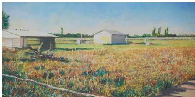
Het geografisch middelpunt van Chili, acryl op paneel

door om President Kennedylanen vast te leggen. In mijn atelier maakte ik een hele schilderijenserie van die deze lanen, die allemaal op elkaar lijken, brede wegen allemaal aangelegd direct na 1963. Dit was de tijd, dat het wagenpark enorm uitbreidde en welvaart over de westerse wereld kwam. De serie was maar beperkt, aan het reizen zat een beperking.